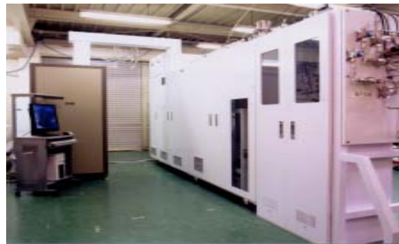
化合物半導体用MOCVD装置