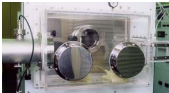
グローブボックス