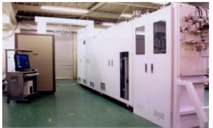
InGaPN 用 MOCVD 装置 (SH2001)