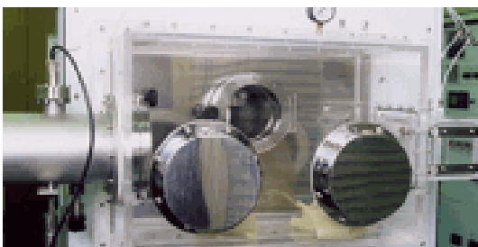
グローブボックス